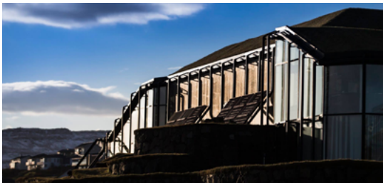
Í januar 2017 gjørdi BankNordik ein stuðulssáttmála við Norðurlandahúsið, og bankin er sostatt ein virkin luttakari í arbeiðinum hjá Norðurlandahúsinum at menna norðurlenska mentan og list.