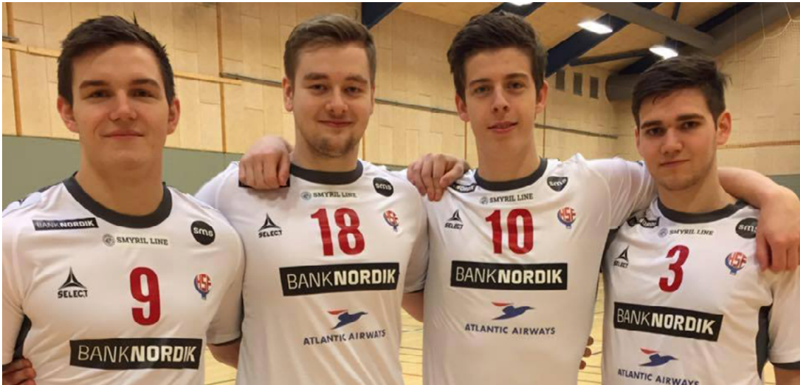
BankNordik er errin høvuðsstuðul hjá føroyska U21 handbóltslandsliðnum, sum í januar 2017 spældi seg víðari til HM-endaspælið í Algeria í juli 2017. Hetta eru fyrstu ferð í søguni, at tað hevur eydnast einum føroyskum landsliði at spæla seg víðari til eitt endaspæl.