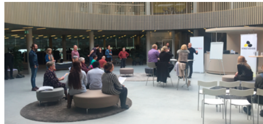
Í apríl 2016 skipaðu BankNordik, Íverksetarahúsið og Útlendingastovan í felag fyri íverksetaraskeiði í høvuðssæti bankans. Tiltakið var serliga ætlað tilflytarum, og snúði tað seg um at menna ferðavinnuna í Føroyum.